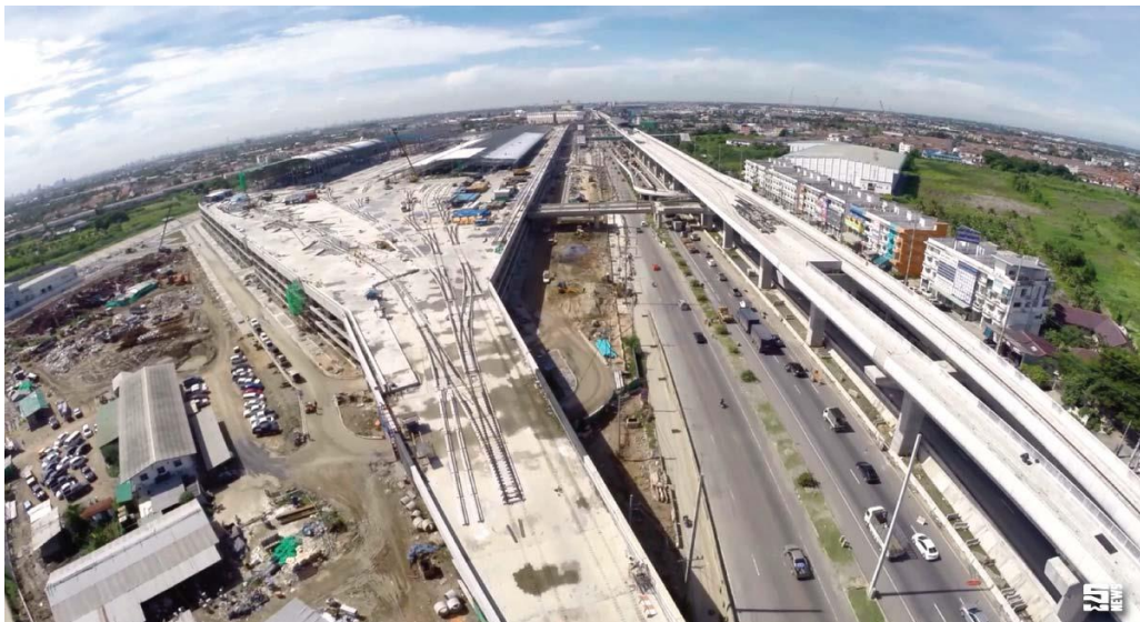
ภาพ : การสร้างถนนและสาธารณูปโภค เป็นหน้าที่ของรัฐบาลให้บริการทางสังคม