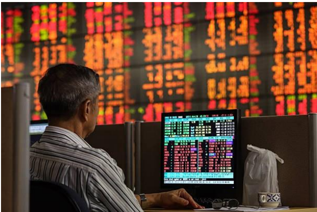
ภาพ : การใช้เงินทุนในตลาดหุ้น