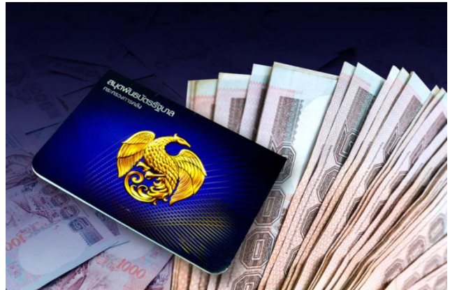
ภาพ : การใช้เงินทุนในพันธบัตรรัฐบาล